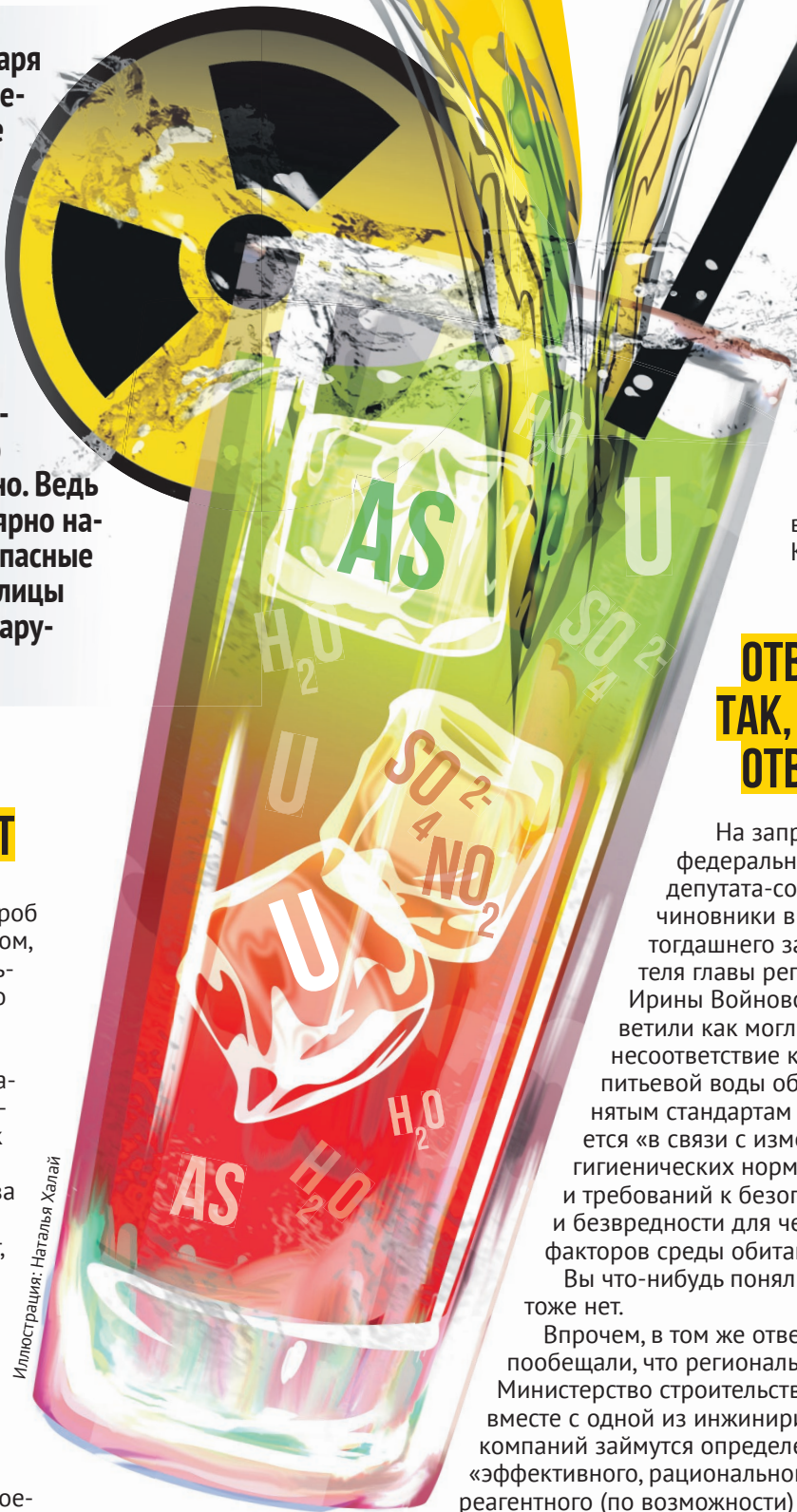
Иллюстрация: Наталья Халай

Зато на самочувствии человека раствор мышьяка отразится довольно быстро и вполне определенным образом: головная боль, сонливость, рвота, диарея... Если отравление продолжается, наступают судороги, паралич и слепота. Уже установлено, что хроническая интоксикация этим соединением приводит к развитию онкологии – от рака кожи до рака внутренних органов.